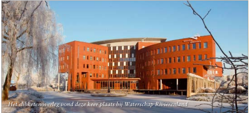
Het slibketenoverleg vond deze keer plaats bij Waterschap Rivierenland

Waterschappen actief betrokken bij nieuw bestuurlijk beraad