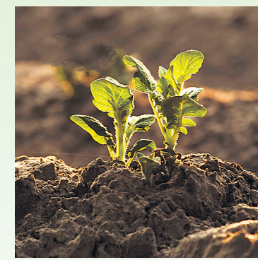
Fosfaat is een onmisbaar element voor de plantengroei.

Fosfaat is een onmisbaar element voor het leven. Mensen hebben fosfaat nodig. Hun botten bestaan voor een groot deel uit fosfaat. Het zit in alle denkbare voedingsmiddelen. Mét kalium en stikstof is fosfaat ook onontbeerlijk voor de plantengroei. Daarom is fosfaaterts een belangrijke grondstof voor kunstmest. Probleem is echter dat de wereldvoorraad winbaar fosfaaterts eindig is.